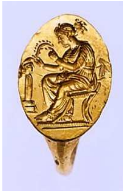
Una donna inghirlanda un'Erma (ambiente domestico). Dall'Ellade, inizio del IV secolo a.e.v. Ora al Metropolitan Museum...

indicando che una simile forma, da qualunque parte cada, è stabile ed eretta da ogni lato. Così ragione e verità sono uguali a se stesse da ogni lato, mentre la falsità è molteplice e divisa ed estremamente discorde con se stessa.” (Suda s.v. Ἑρμῶν. Ἑρμῶι) Dunque, le Erme, soprattutto quelle tricefale, non solo portavano iscritti i nomi delle vie verso cui guardava il volto (Suda s.v. Τρικέφαλος), ma soprattutto portavano iscritte massime simili a quelle Delfiche (Pl. Ipp. 228d).