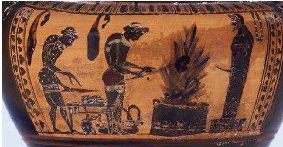
Sacrificio a Hermes itifallico (le corone sono di mirto, gli abiti rosso porpora; trapeza per il Dio) Dall'Attica, 520-510 a.e.v. Ora al British Museum....

effettivamente si dà il caso che ottenga davvero quello che si sia proposto), mentre negli immaturi è sterile ed imperfetto.” (Corn. Comp. Theol. 16)