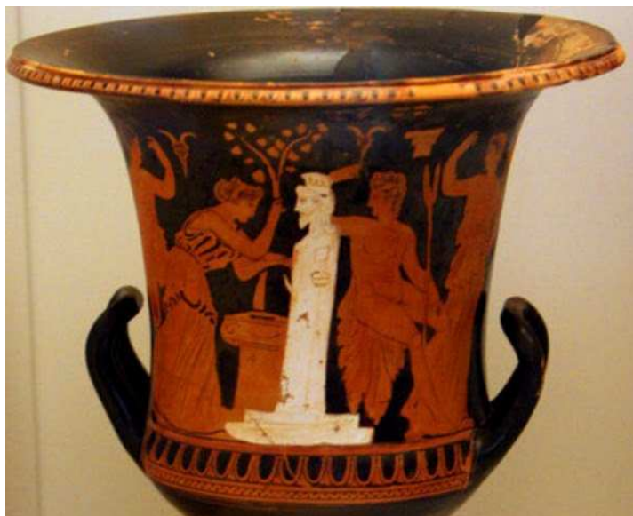
Cratere attico, che rappresenta una donna che adorna un'Erma itifallica con un altare di fronte. (350-325 a.e.v. National Archaeological Museum, Athens.)