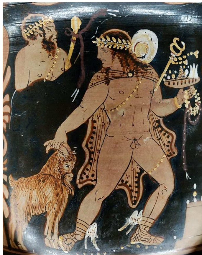
Hermes conduce una capra all'altare (ghirlanda e nastro rosso e bianco; torta pyramis ; primizie e kollyba ) Da Paestum, 360–350 a.e.v. Ora al Louvre ....