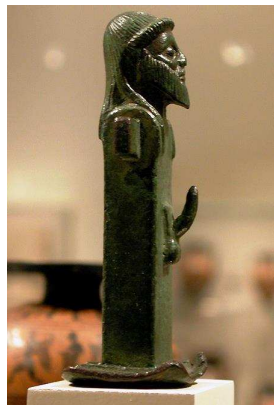
Piccola Erma in bronzo per uso domestico (età arcaica, dall'Ellade – ora al Metropolitan Museum...)